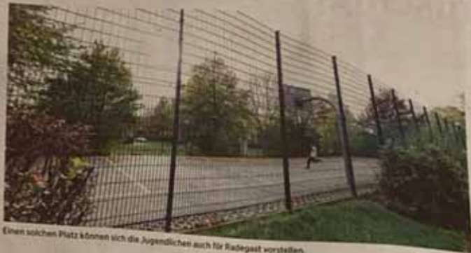
Einen solchen Platz können sich die Jugendlichen auch für Radegast vorstellen.

Nachdem bei einem ersten Treffen Vorschläge zusammengetragen wurden, ging es beim zweiten Mitte Oktober darum, vier besonders beliebte Ideen weiter auszuarbeiten. Beispiel Skaterpark: Der könnte nahe des